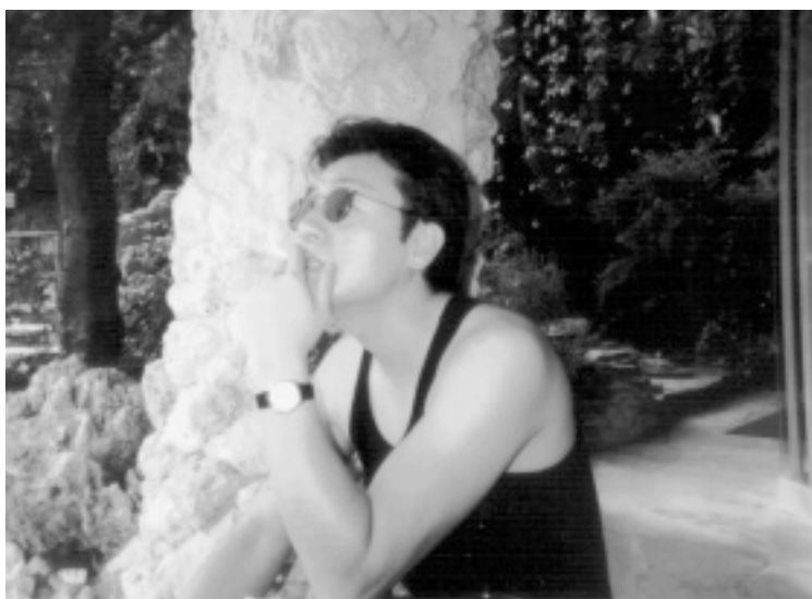
パリ、ド・ゴール空港にて