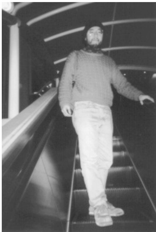
南仏にて構想中の画伯。ヒゲを剃った模様。